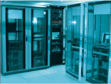
EFCC, IKOYI (Lagos) Data Centre