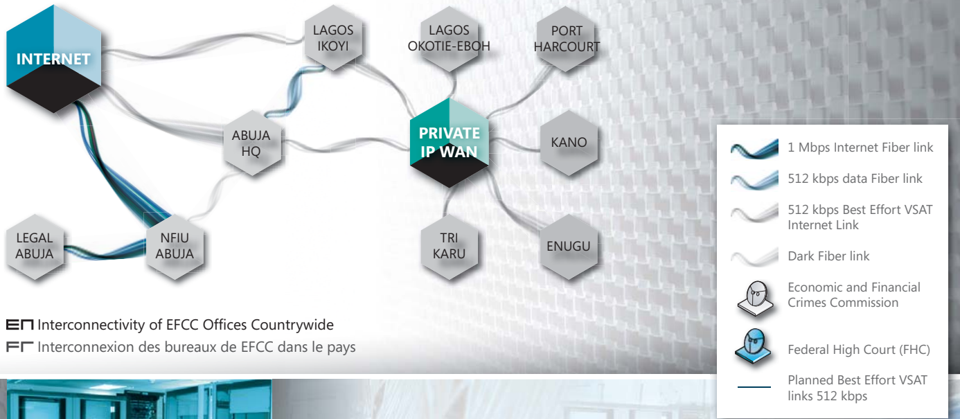
EN Interconnectivity of EFCC Offices Countrywide FF Interconnexion des bureaux de EFCC dans le pays